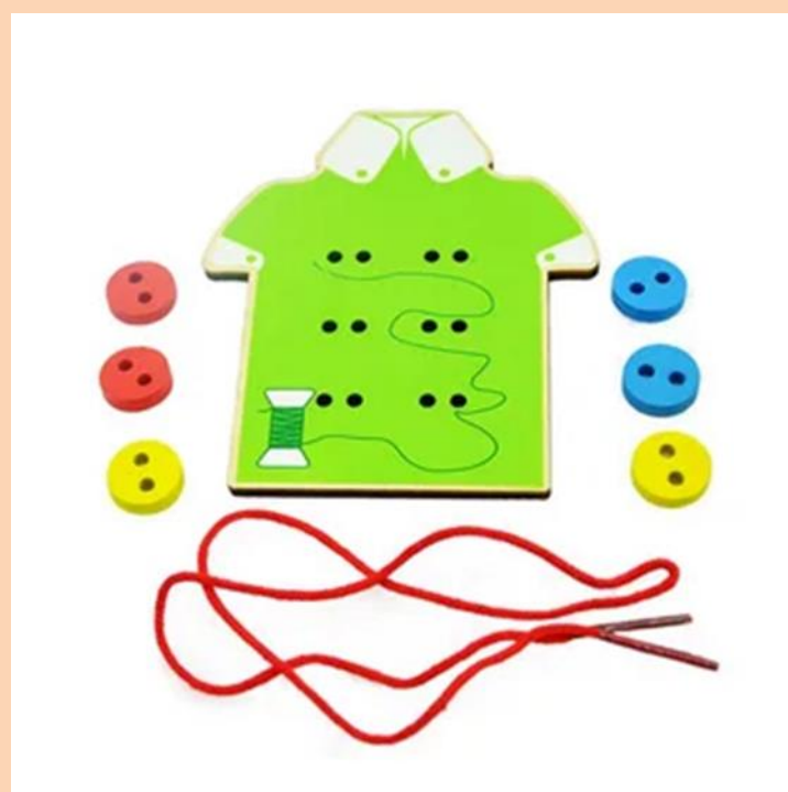
Рисунок 3 – «Шнуровка-пуговицы»

Также ребенку важно подражать взрослым, для этого рекомендуется обучать детей пришивать пуговицы, безопасным способом, с помощью Игры-Шнуровки, представленной на рисунке 3 можно практиковаться в завязывание шнурков и в пришивании пуговиц. Это замечательная игра предназначена для развития ума и мелкой моторики. Она подходит и для индивидуальных творческих занятий, и для совместного досуга.