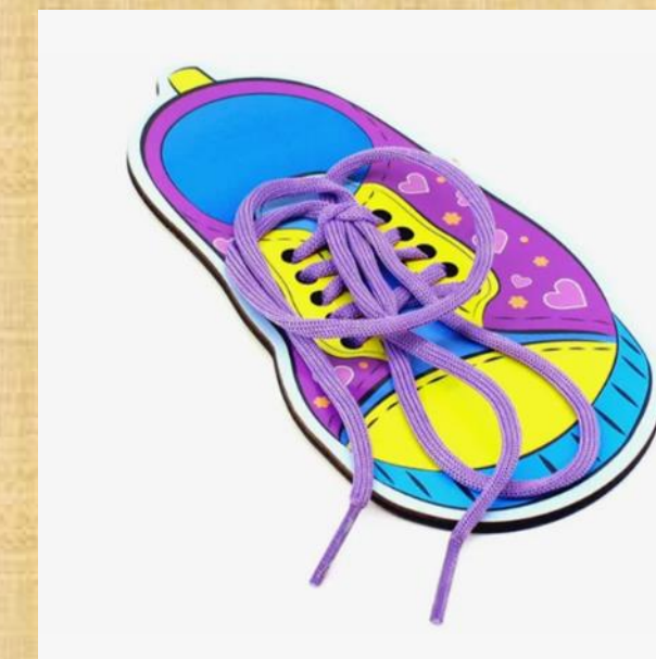
Рисунок 2 – «Игра-шнуровка» для завязывания шнурков