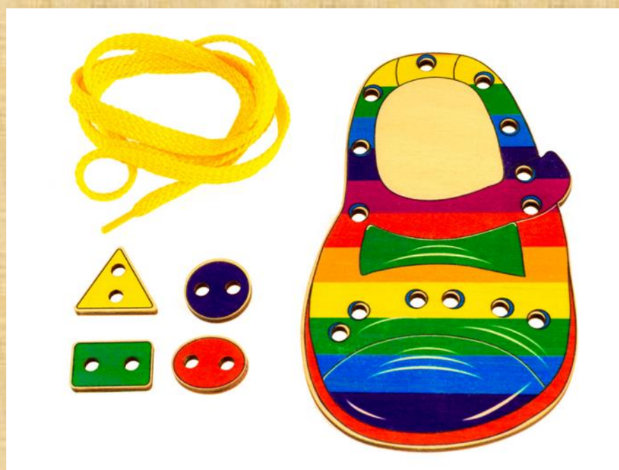
Рисунок 1- Игра -шнуровка "Матрешка"